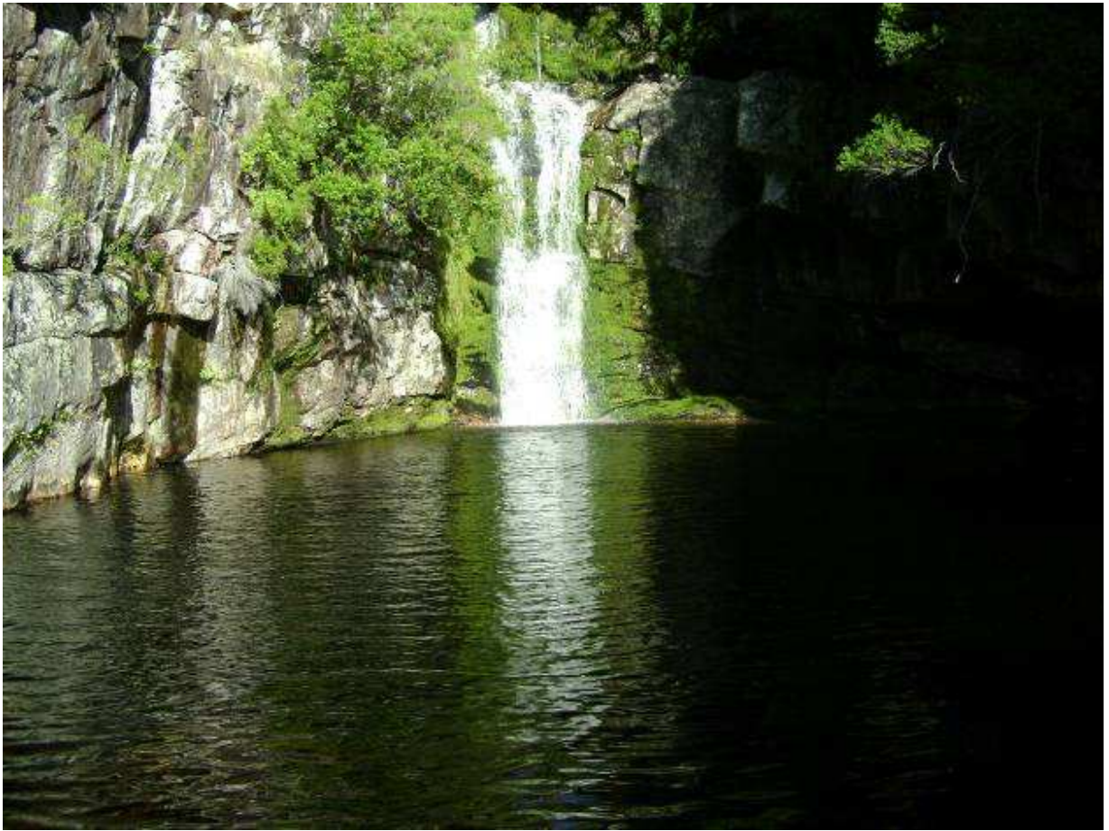
Die waterval waar ons omgedraai het (Het baie lekker daar geswem)