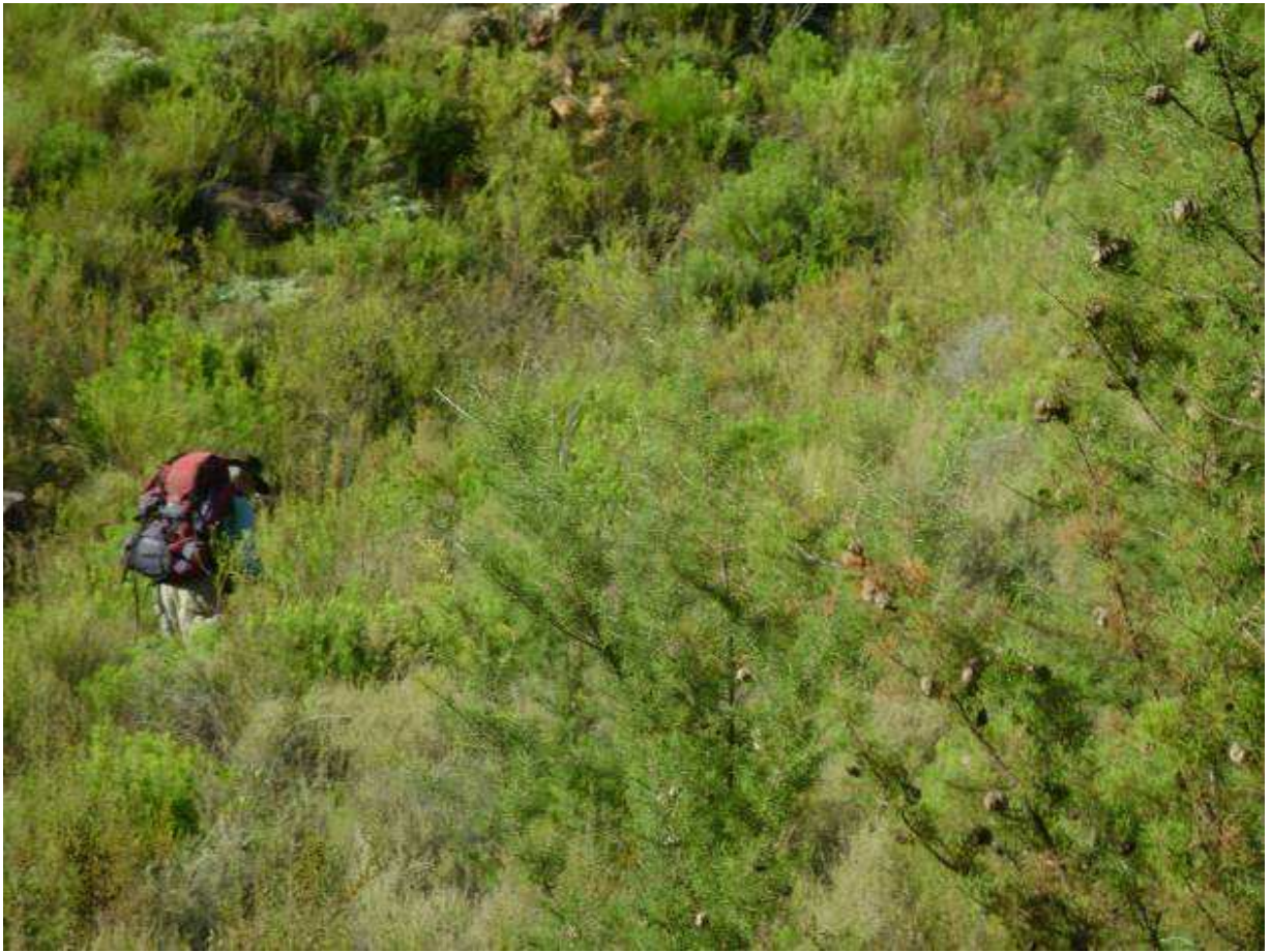
Daar is baie hakis in die berge rondom Tierstelkooft