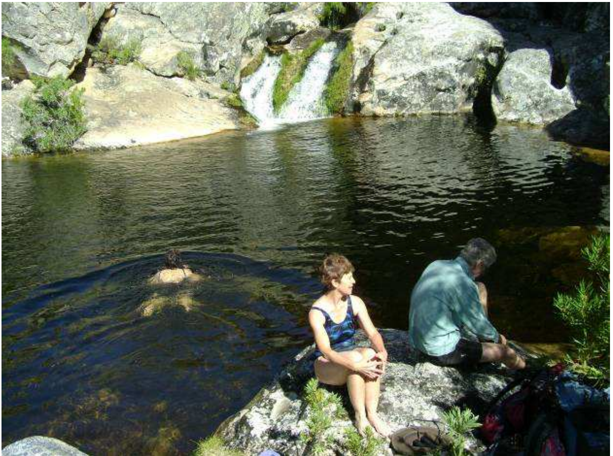
Die poele in Tierstelkloof is groot, diep en lekker om in te swem