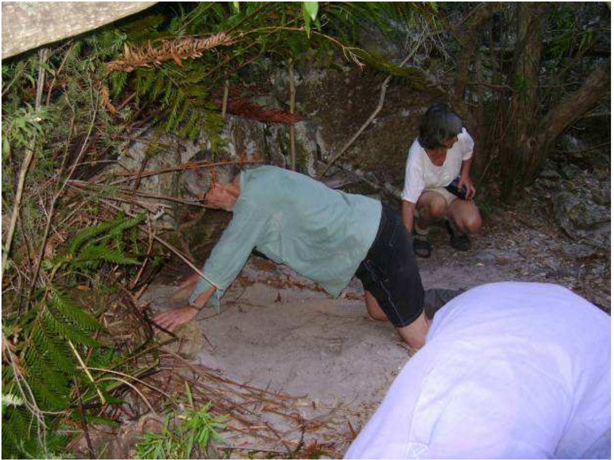
Charl maak sy slaapplek gelyk